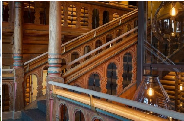
Holmenkollen Scandic Park Hotel